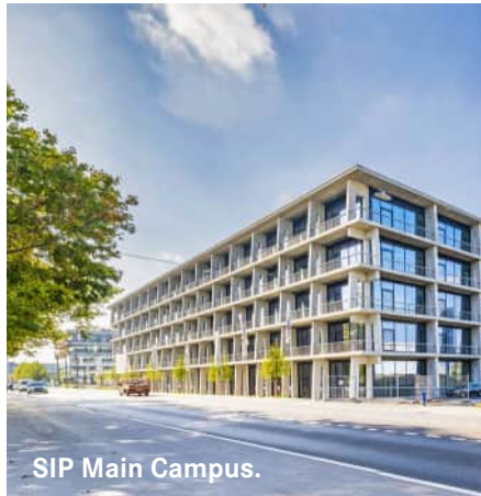
SIP Main Campus.

ARGE KISPI Herzog & de Meuron/Gruner AG Wettbewerb 1. Rang 2011-2012, 2014-2024