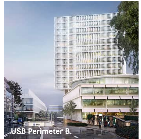
USB Perimeter B.

ARGE VOSS Architects und Elbeling Architekten Wettbewerb 1. Preis 2015, 2016-2019