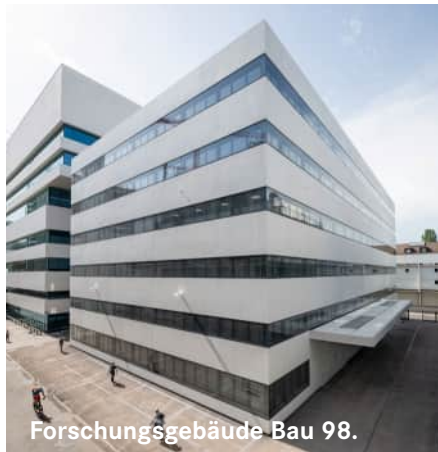
Forschungsgebäude Bau 98.

Comamala Ismail Architectes Wettbewerb 1. Rang 2021, 2022-2024