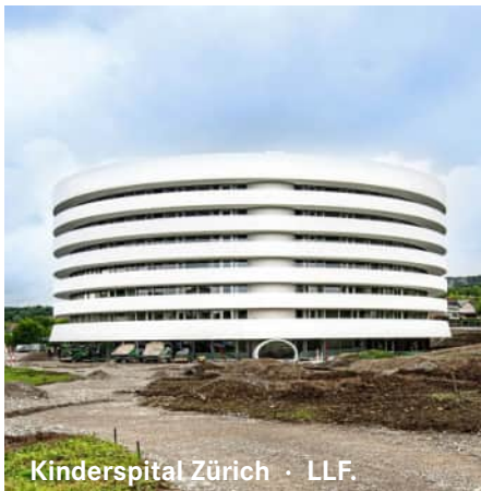
Kinderspital Zürich - LLF.

ARGE KISPI Herzog & de Meuron/Gruner AG Wettbewerb 1. Rang 2011-2012, 2014-2024